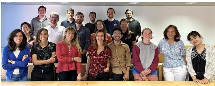
Das letzte Kolloquium vom 22. Juni 2022